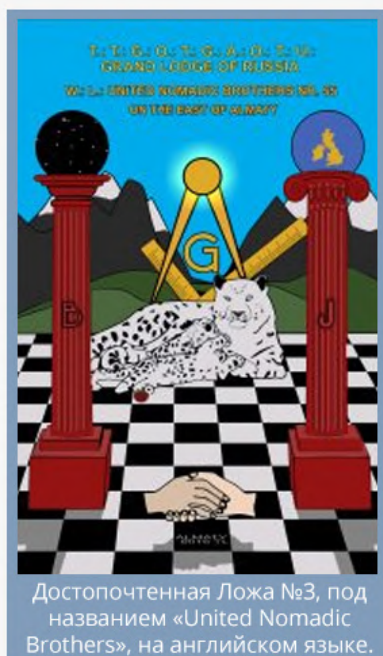
Достопочтенная Ложа №3, под названием «United Nomadic Brothers», на английском языке.