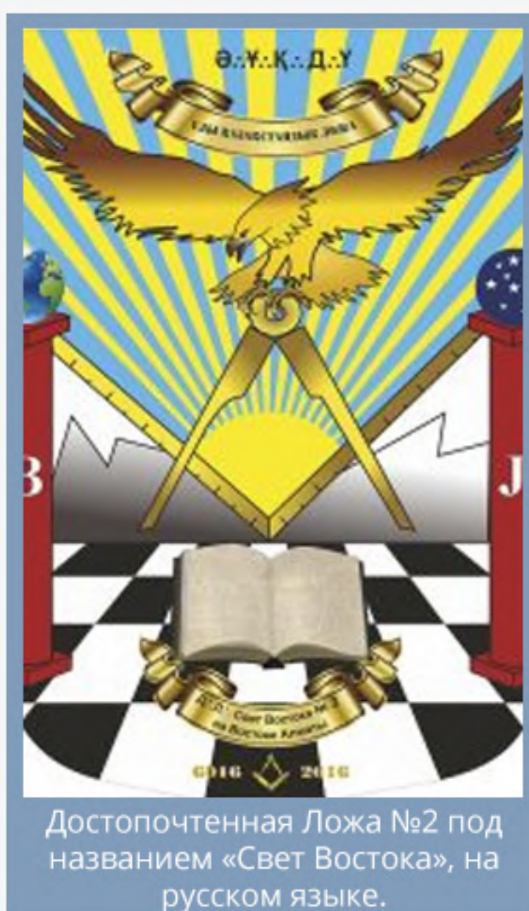
Достопочтенная Ложа №2 под названием «Свет Востока», на русском языке.