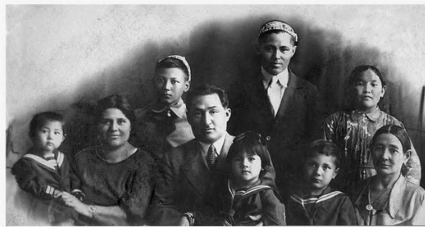
Алихан Бокейханов с семьей