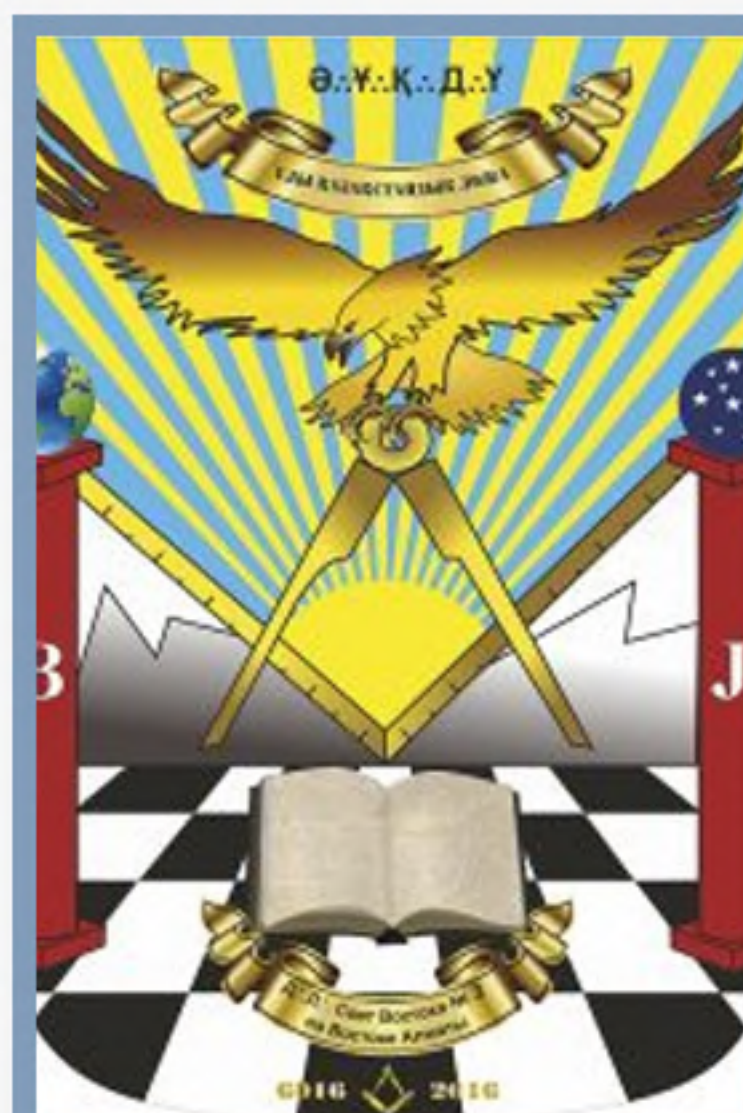
Достопочтенная Ложа №2 под названием «Свет Востока», на русском языке.