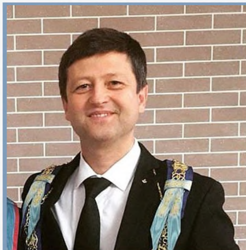
ЗАМЕСТИТЕЛЬ ВЕЛИКОГО МАСТЕРА