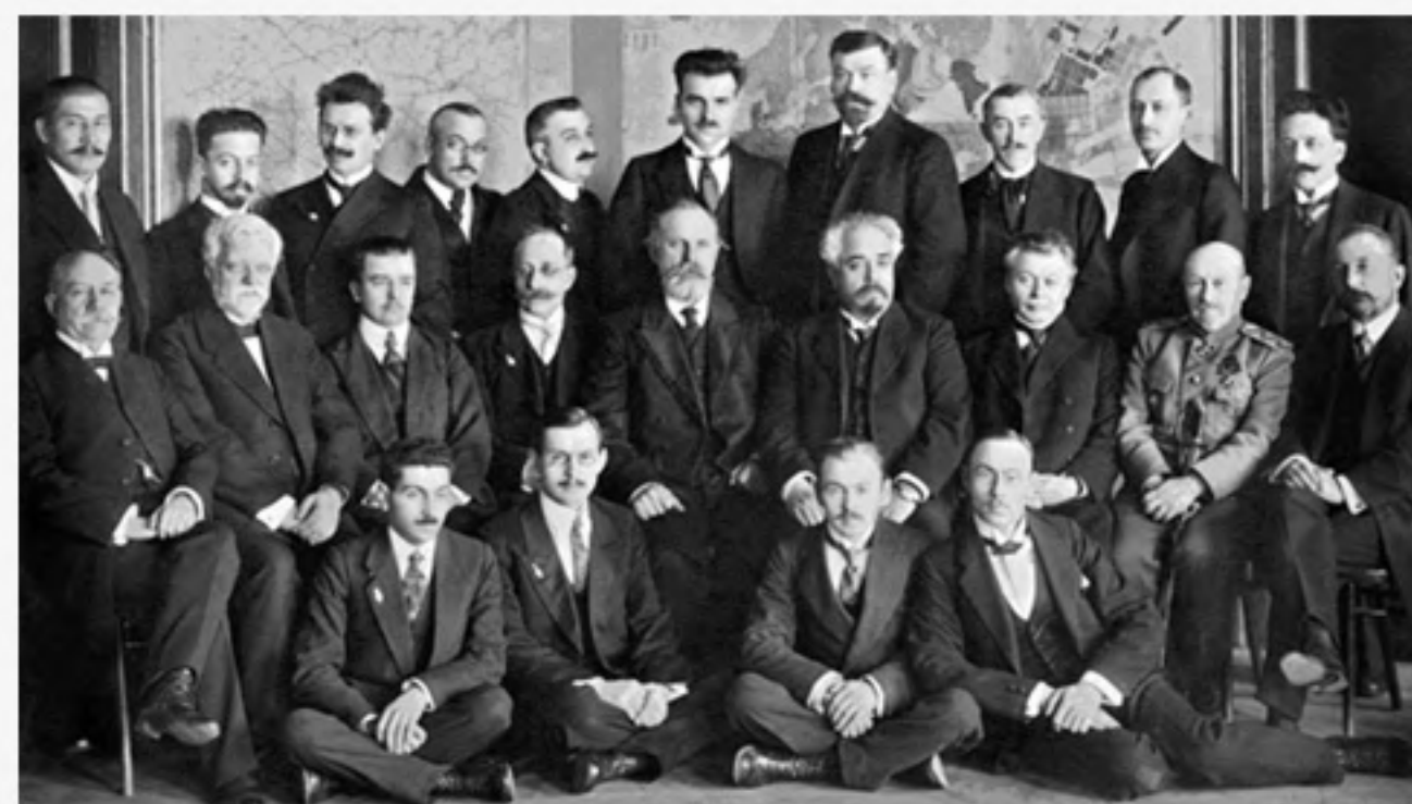
Тайный орден "вольных каменщиков"

Относил себя к «западническому направлению» общественного движения казахской интеллигенции, которая «видит будущее киргизской степи в сознательном претворении западной культуры — в самом широком смысле этого слова» и «возьмёт за образец... в частности, Партию Народной Свободы» («Киргизы», в книге: Формы национального движения в современных государствах , СПб., 1910, с. 599). В то же время он активно боролся против русской колонизации Киргизской степи. Алихан Букейханов стал первым биографом Абая. Его статья «Абай (Ибрагим) Кунанбаев» — некролог казахского народного поэта в связи с характеристикой его творчества была напечатана в газете «Семипалатинский листок» в 1905 году. Затем с портретом Абая она печаталась в журнале «Записки Семипалатинского подотдела Западно-Сибирского отдела Императорского Русского географического общества» в 1907 году.