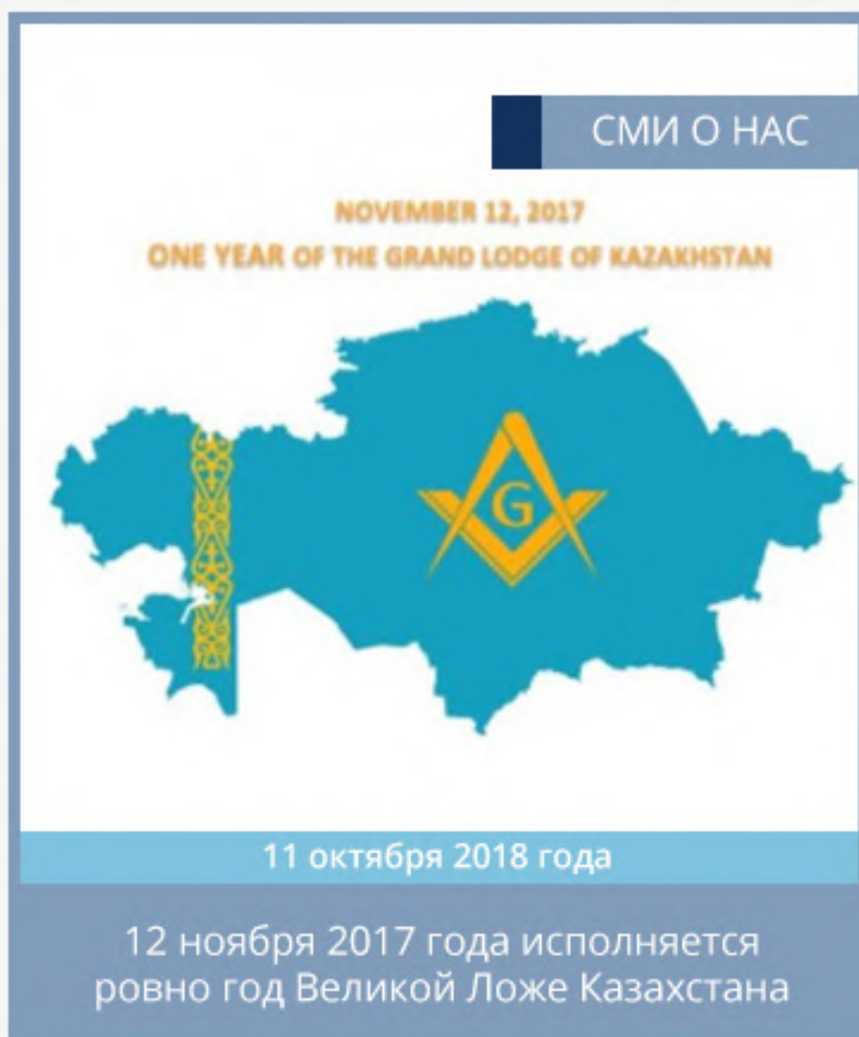
11 октября 2018 года 12 ноября 2017 года исполняется ровно год Великой Ложе Казахстана