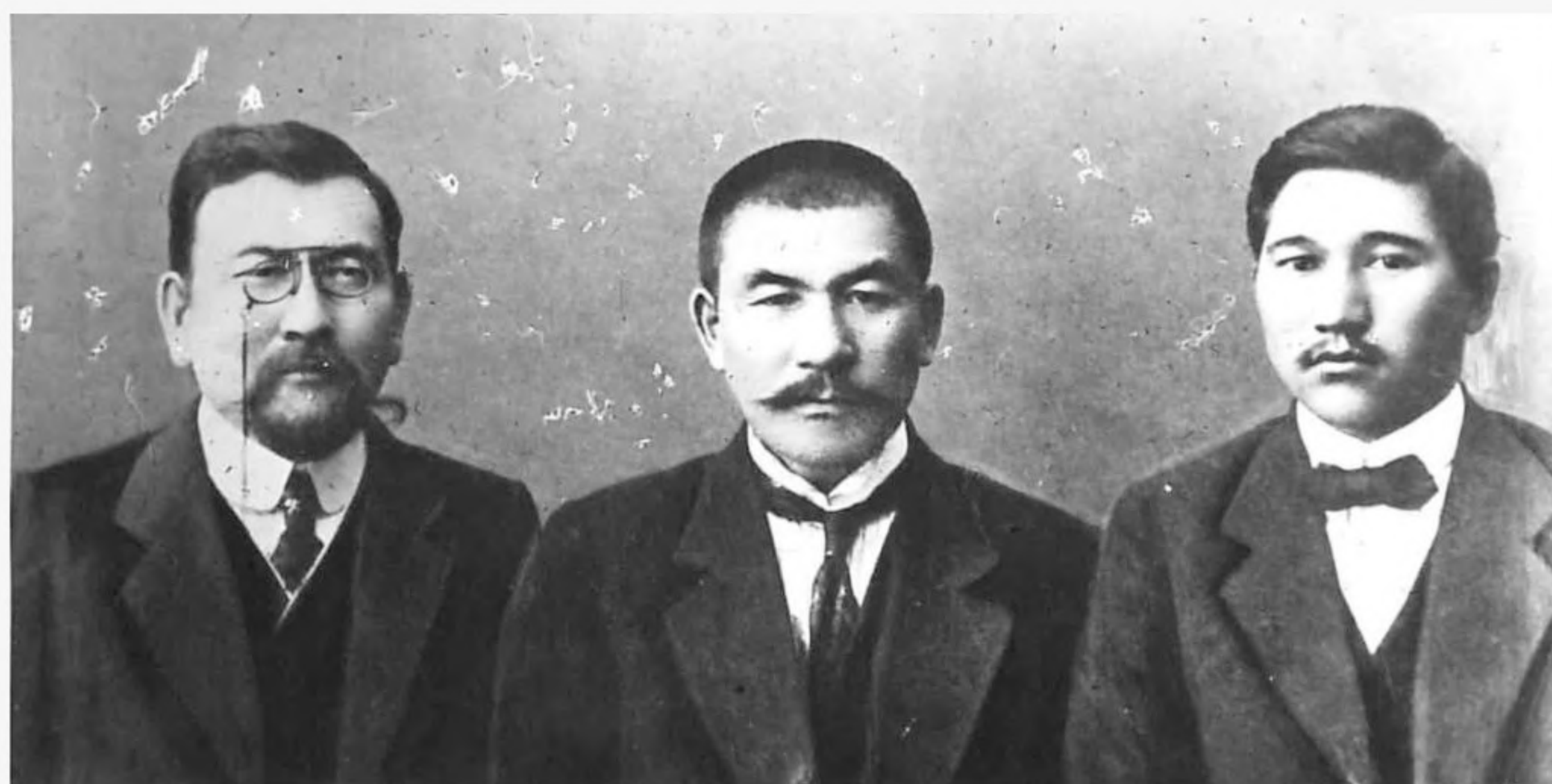
Ахмет Байтурсынов, Алихан Бокейханов, Мирзакип Дулатов (1913 год)