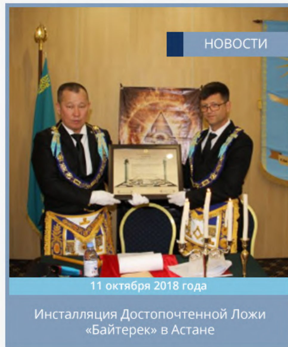
11 октября 2018 года Инсталляция Достопочтенной Ложи «Байтерек» в Астане