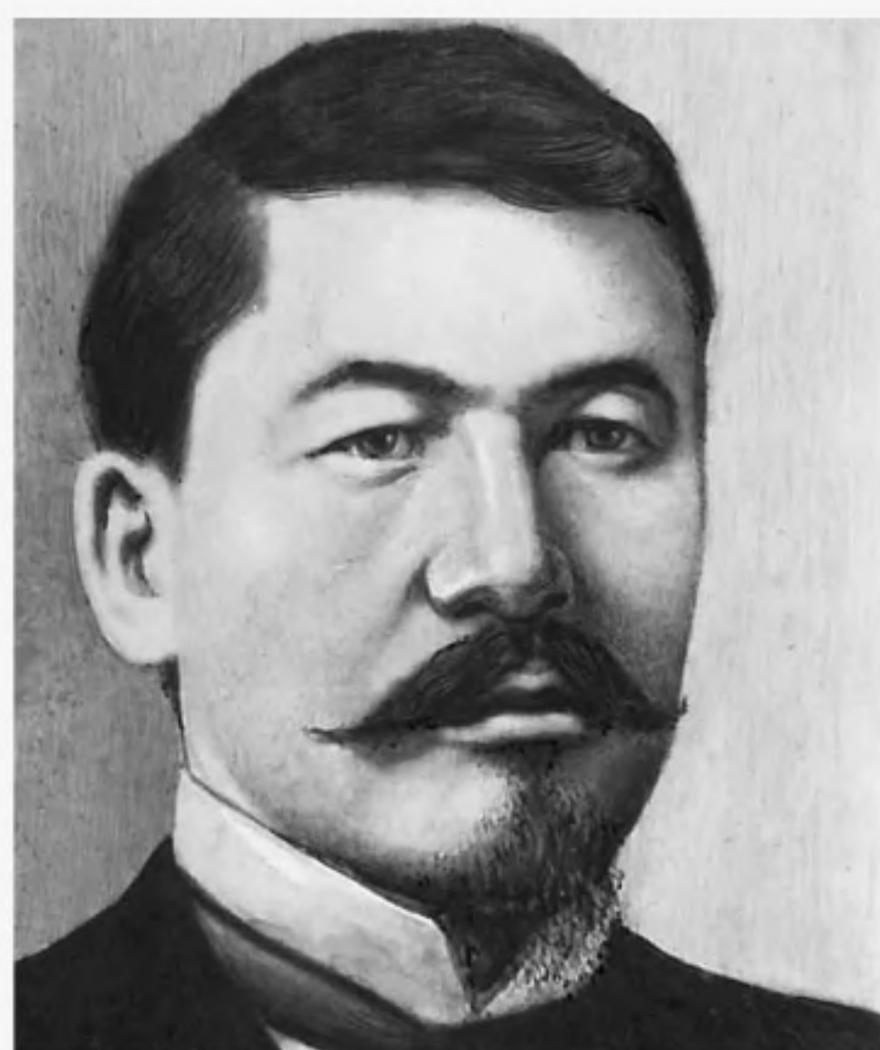
На Выборгском процессе, декабрь 1907

Алихан Букейханов (каз. Әлихан Бөкейхан; 1866, Токраунская волость, Каркаралинский уезд, Семипалатинская область, Российская империя — 27 сентября 1937, Москва, СССР) — казахский общественный деятель, преподаватель, журналист, этнограф. Один из лидеров партии «Алаш», комиссар Временного правительства по Казахстану (1917). Председатель (премьер-министр) Алашской автономии с 1917 по 1920 годы. Алихан Букейханов считается первым премьер-министром Казахстана. Принадлежал к потомкам казахских «чингизидов» торе. Окончил Омское техническое училище, затем экономический факультет Петербургского лесного института. Занимался статистикой. Сотрудничал с газетой «Семипалатинские областные ведомости»