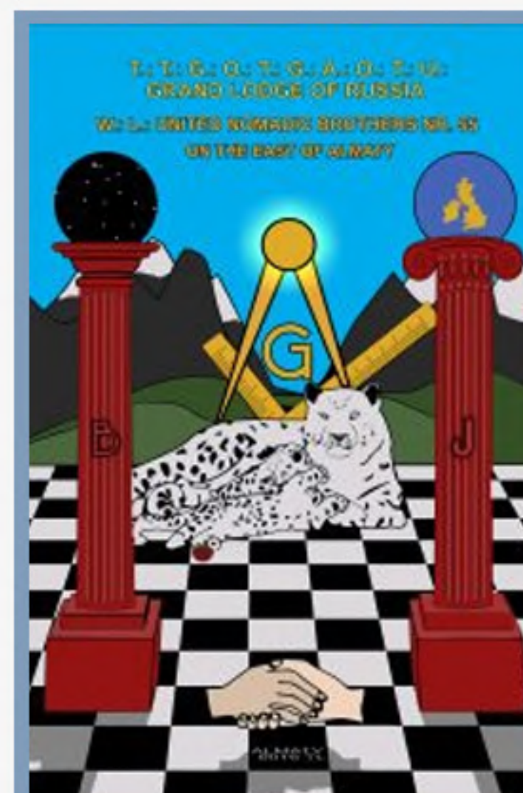
Достопочтенная Ложа №3, под названием «United Nomadic Brothers», на английском языке.