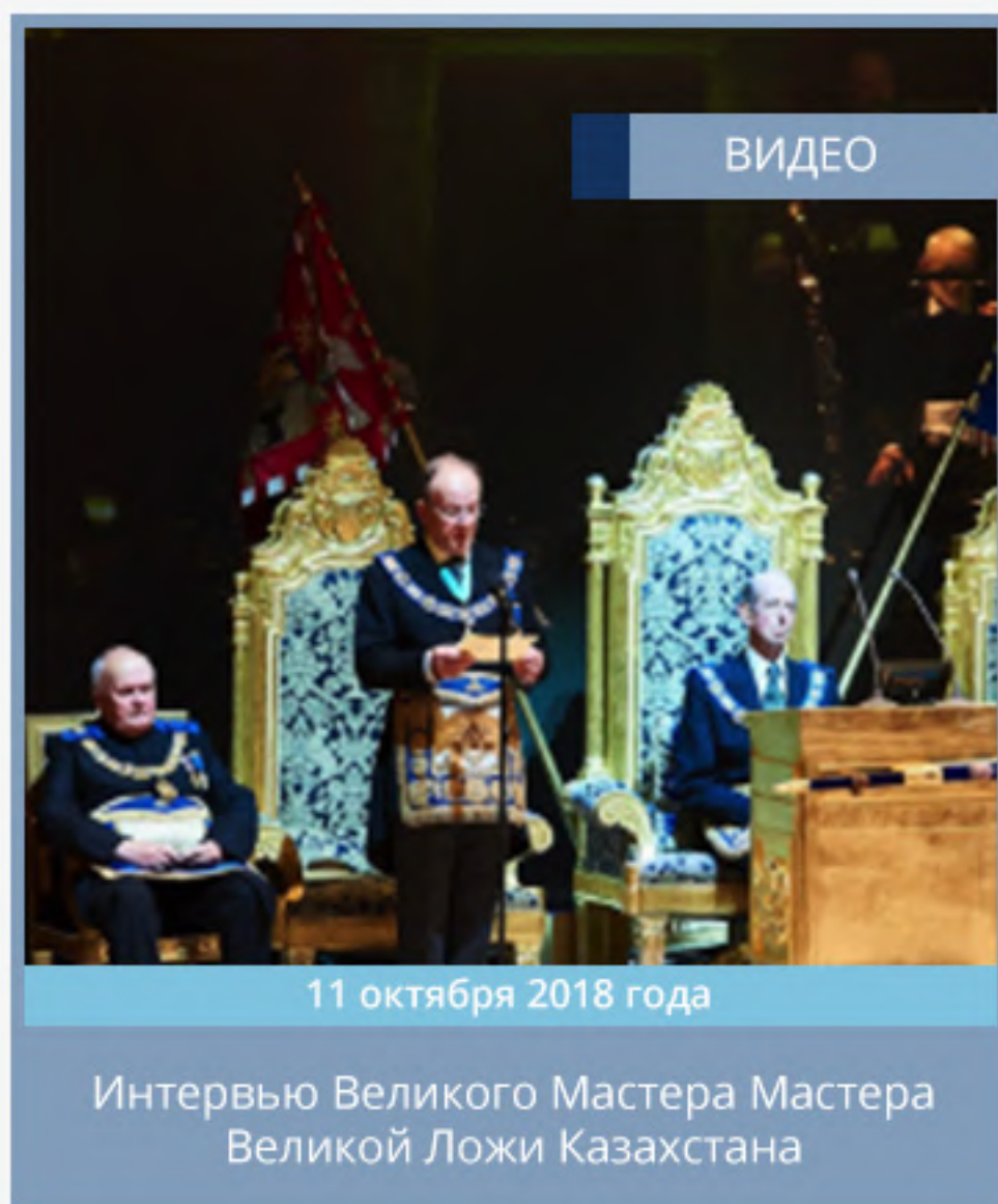
11 октября 2018 года Интервью Великого Мастера Мастера Великой Ложи Казахстана