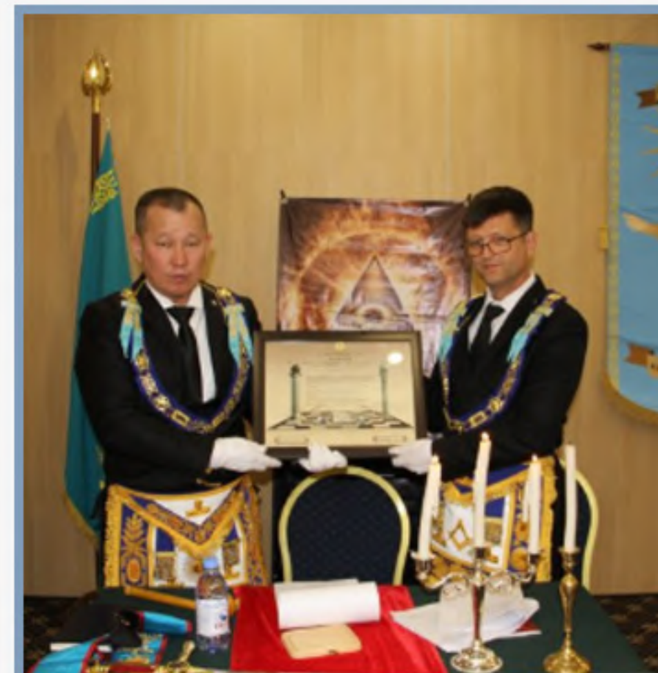
ПОМОЩНИК ВЕЛИКОГО МАСТЕРА