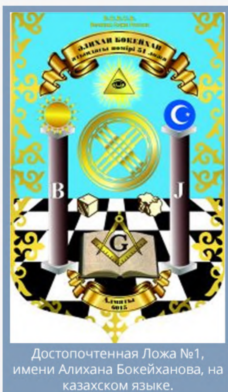
Достопочтенная Ложа №1, имени Алихана Бокейханова, на казахском языке.