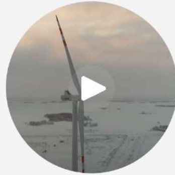
Имиджевый ролик о компании