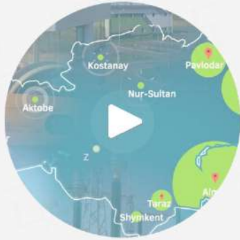
Видео о нашей деятельности